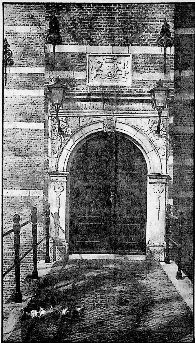
• Kasteelpoort Bouvigne.