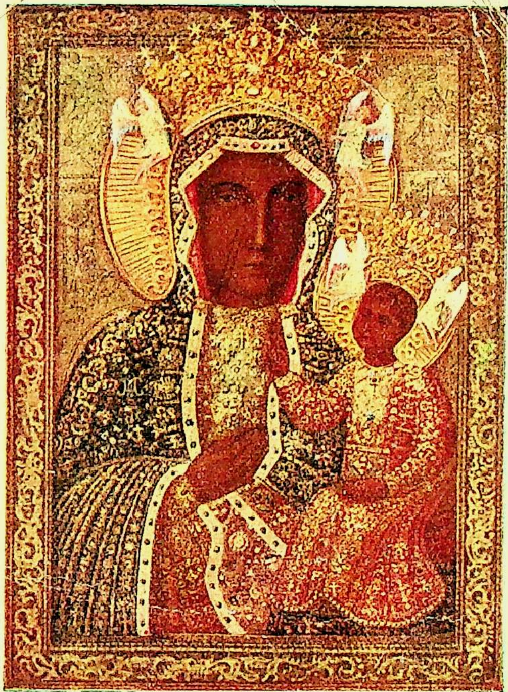
MATKA BOSKA CZĘSTOCHOWSKA