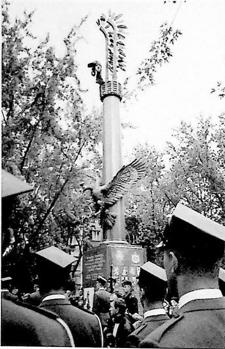
Hert monument voor de Eerste Poolse Tankdivisie in Warschau dat op 30 september 1995 werd onthuld.

de oprit naar het erf. Dan moet het gebeuren, de weg oversteken... Zonder te wachten of te twijfelen, kruipen we naast elkaar zo plat mogelijk over de grond schurend, elk moment een salvo kogels verwachtend.